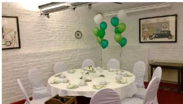
Kunterbunt oder klassisch in der Stallung