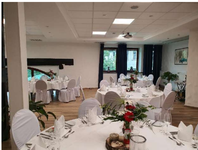
Festlich eingedeckter Tisch mit Centerpiece in der Tenne