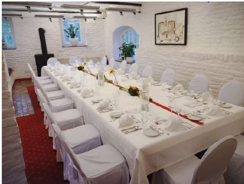
Hochzeitstafel in der Stallung