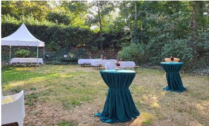
Hochzeitskaffee im malerischen Hotelpark

Im Danielshof bieten wir Ihnen alle Möglichkeiten für ein Hochzeitsfest ganz nach Ihrem Geschmack. Sie möchten nach Ihrem Ja-Wort in stilvollem Ambiente Ihre Traumtorte anschneiden? Oder soll es ein unvergessliches, rauschendes Fest werden?